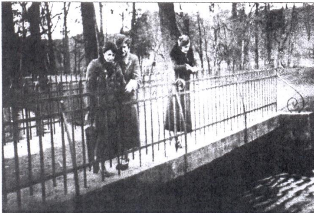
Мостик через Гордничанку. 1930-е годы.