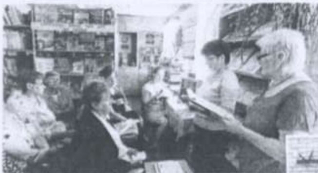
Літаратурная гадзіна ў Стралецкай бібліятэцы.

захаванне гэтых здабыткаў і іх аналіз. Вучоны распавядаў пра сваю дзейнасць, пазнаёміў з відэаархівам апошніх экспедыцый у Літву, адказаў на пытанні землякоў".