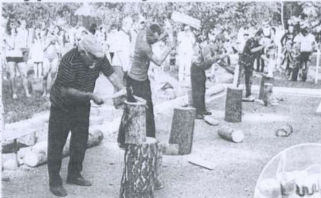
Плячас свята Смерці ў аграгарадку Турнова Ліскага раёна.

лі яшчэ конкурс прыпевак, заданні для мужчын "Самы дбайны гаспадар", вясёлыя забаўкі для дзяцей. Потым, натуральна, адбыўся канцэрт". "Гурь маньку хавбовь". Незразумела? У перакладзе з катрушніцкага лемезеня гэта — "Дай мне грошай". Дык вось, на рэгіянальным фестывалі народнай творчасці, народных промыслаў і рамёстваў "Дрыбінскія таржжкі", якія прайшлі ў мінулыя выхадныя, грошай ніхто не прасіў. Іх зараблялі. У першую чаргу — рамеснікі па вырабе знакамітых дрыбінскіх валё-