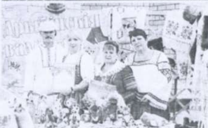
Удзельнікі "Дрыбінскіх таржжкі" і іх знакамітыя вырабы.

даўгалецця, — паведамляе яна. — Урачы мясцовай паліклінікі пазнаёмілі з навыкамі скандынаўскай хадзьбы. Бібліятэкары арганізавалі выставу адпаведнай літаратуры. Услед за тэорыяй была і практыка на адкрытым паветры. Цягам тыдня да энтузіястаў падключыліся валанцёры Чырвонага крыжа, Цэнтра творчасці дзяцей і моладзі, тэатральнага цэнтра сацыяльнага абслугоўвання насельніцтва. Арганізатарам тыдня выступіла Астравецкая раённая бальніца".