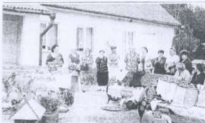
На конкурсе "Добры дзень, суседзі!" у Рагачоўцы перамагло сяброўства.